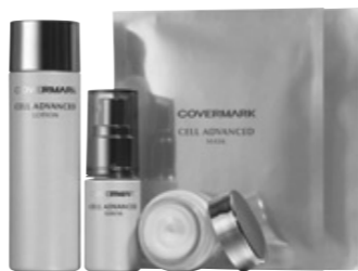
カバーマーク セルアドバンス セレクション1万500円(セット内容 化粧水ハーフサイズ75ml、美容液ハーフサイズ20ml、クリームハーフサイズ15g、美容液マスク2枚)☎0120・117133

に直接アプローチするらしいんですね。来年、1月の新発売に先がけてリリースされたお試しセットを入手、真っ先にマスクから試してみたいんですが、すごい速効力で肌にぐんぐんハリが満ちてくるのがわかりました。翌朝、顔を洗った後もふっくらしつところ」