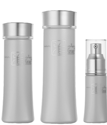
善悪のシリウス、すべてにcPAを配合。うるおいをたっぷり与える。無香料、無着色、無鉱物油。左からクレイ乳液100ml 7,350円、クレイ化粧水150ml 6,300円、クレイ美容液30ml 9,450円(ESMSH0103・52030716)

川津幸子さんが惚れ込んでいるスキンケアが(雅Elixir)(クレイ)。お茶の水女子大学の室伏きみ子教授が発見した「環状ホスファチジン酸(cPA)」配合の化粧品である。「3か月ほど前、発売されたばかりの時にすすめられたのがきっかけです。ヒアルロン酸は分子量が大きくなり、肌から吸収しにくいので、外から与えるのではなく細胞本来のヒアルロン酸を増やす、その役割をするのが