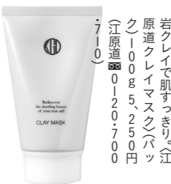
ミネラル豊富なモロツコ溶岩クレイで肌すっきり。全原産クレイマスク(パッケージ)100g 5,250円 (全原産)0120・7007100 「ストレスが多いときに、オリジナルで調合してもらおうサプリです」(東京ミッドタウン美容クリニック☎0120・260・386)

「即効性のある化粧品が好き」と言うレイネンさん。「あす大事な人に会う、という時には、江原道の(クレイマスク)。ファンデーションが要らないくらい肌に透明感が出ます。美容液状の(マクロヴィンテージナノCパウダー)も翌朝、肌がツルツル、シロシロになりますね」 目じりや目の下の小じわ対策に、レイネンさんが注目しているのが、(ミューノアージュアドバンストラインソリュションM(ミュー))。よ