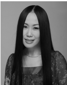
ヘアサロンAMATA主宰。「加齢で能力は衰えても努力で補えることは多い。リフトアップのためにも頭皮マッサージはおすすめ」