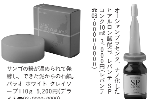
オーションプラセンタ、ナノ化したヒアルロン酸配合レバンテSP コンク10ml 3,000円(レバンテ☎03・0000・0000) 豚由来約300倍の必須アミノ酸を含む馬プラセンタ使用。ピュルサン プラセンタ 320粒 8,800円(イーアンドケー☎03・3538・6751)

生理不順がひどいときに病院で受けたプラセンタ注射がきっかけで、プラセンタの美肌効果に注目。「たったの1回の注射で、ごわついていた肌がなめらかになったんです。美白にもよいと聞きましたが、注射を頻繁に受けに行く時間がないので、サプリメントを飲むように」 スキンケアも、とインターネット