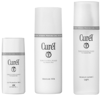
肌を持つ潤い成分セラミドを守り、刺激をうけにくくする。右から(キュレル化粧水)Ⅰ・Ⅱ・Ⅲ)150ml 0,000円 (キュレル乳液)120ml 0,000円 (キュレル泡洗顔料)110ml 0,000円。いずれも医薬部外品。(花王☎03・5630・5040)

「今年3月に40歳になったのですが、その頃、肌荒れがひどくなって皮膚科に通うように。医師からアトピーかもしれないと言われました」 そんな新田恵利さんに皮膚科医がすすめたのが、花王の(キュレル)。「刺激がないので、安心して使えました。『高かったらどうしよう』と思いましたがそうでもなくて、ホッ(笑)。どこでも手に入るのも便利です。漢方や人參ジュースで体質改善を図り、キュレルでスキンケアを続