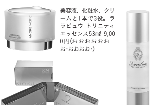
高麗人參などを配合。タイムレス アイクリーム15ml 3万2550円(アモーレバシフィック ジャパン☎03・5776・2700) あごの部分は引き上げ、目元や頬には潤いを重視。ECM記憶マスク 上下2枚×5セット 1万500円(リサーチ☎0120・417・134)

自然素材を生かしたのから最先端技術を駆使したのまで、先人観にとられずにトライする美香さん。「ラビユウのエッセンスは乾燥でポロポロになっているときや、肌が敏感になっている季節の変わり目に。たちまち復活しますよ」 韓国の人気ブランドも愛用。「漢方の素材が入っているんです。