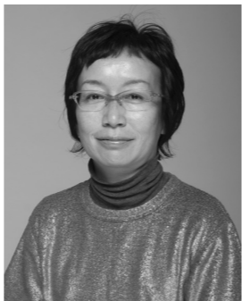
「肌って再生するんだ、諦めちゃいけないってつくづく。早く家に帰ってスキンケアしたいなど、自分の素肌にときめています」

でプラセンタ配合の美容液を購入。「肌がつちりとして、吹き出物ができなくなりました。肌の透明感もアップしたように思います」